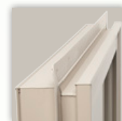
Acabados enclavados pretroquelados y canal en J integrado