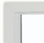
Carcasa plana de 3 1/4" con borde redondeado