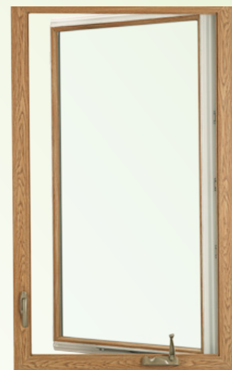
Marco giratorio con ventilación simple