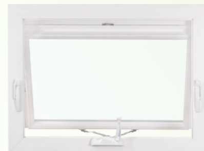
Marquesina con ventilación simple