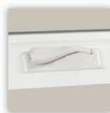
Manija de bajo perfil