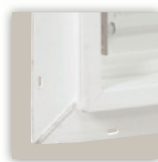
Acabado enclavado pretroquelado