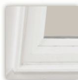
Exterior de moldura de ladrillo