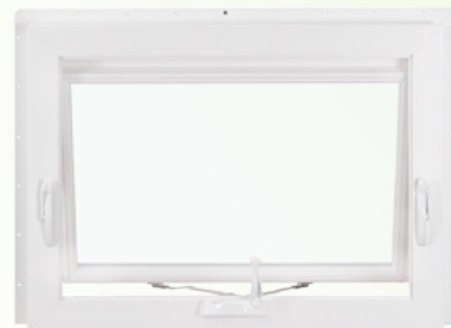
Marquesina con ventilación simple