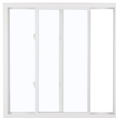
Ventana deslizante de 2 vidrieras